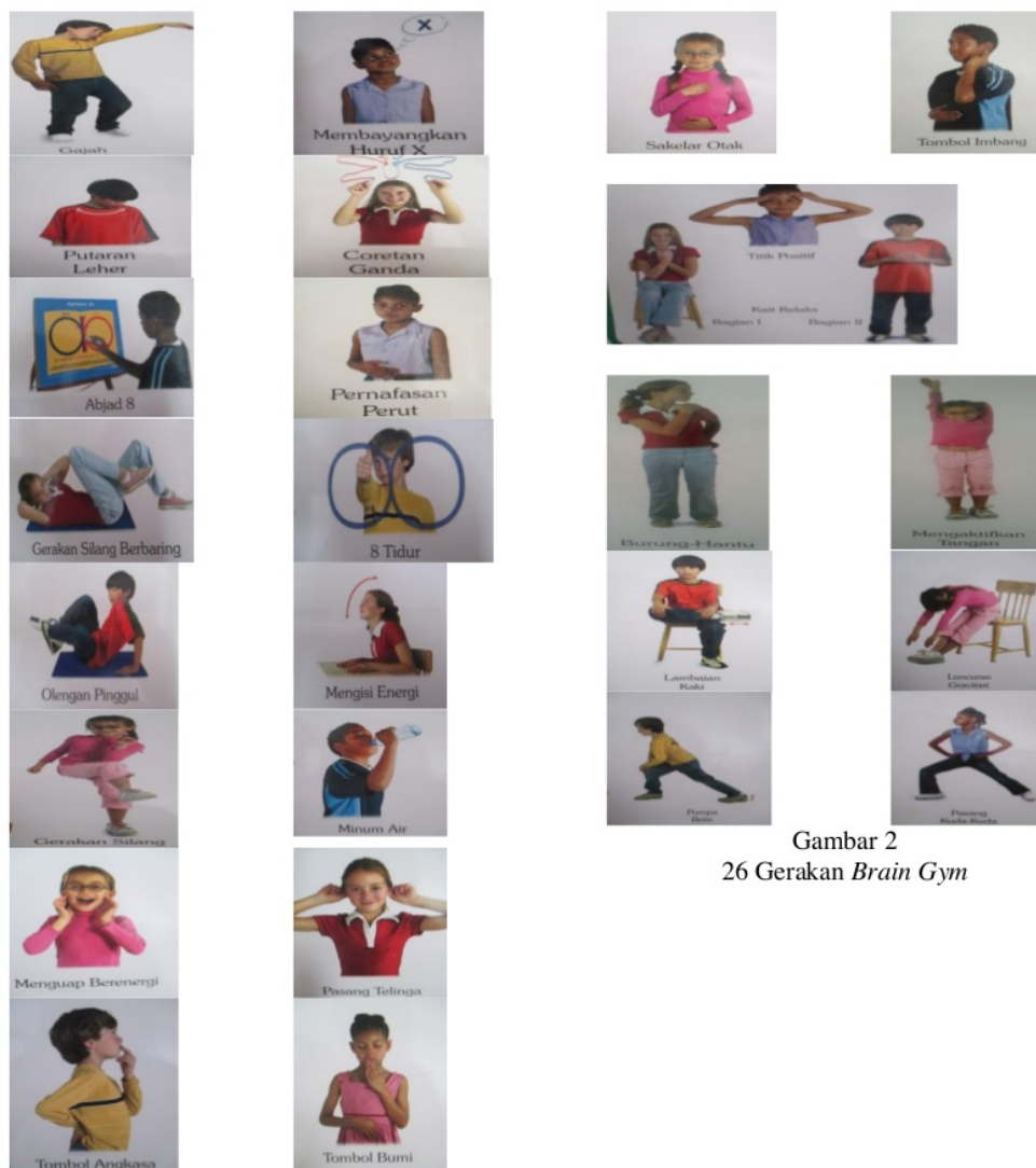
Gambar 2 26 Gerakan Brain Gym

Pengujian Hipotesis: kedua, ketiga, keempat dan kelima dapat dideskripsikan sebagai berikut: